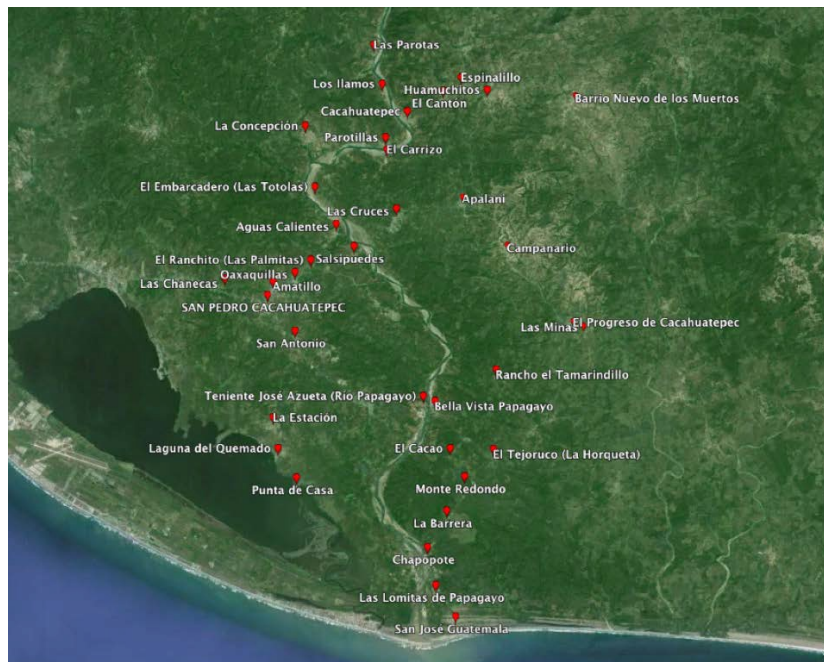
Mapa 1. Territorio ocupado por los Bienes Comunes de Cacahuatepec

Los entornos locales (Figura 1), compuestos en su mayoría de selva baja caducifolia (ambientalmente frágil) han sufrido un fuerte proceso de reducción en los últimos 30 años,