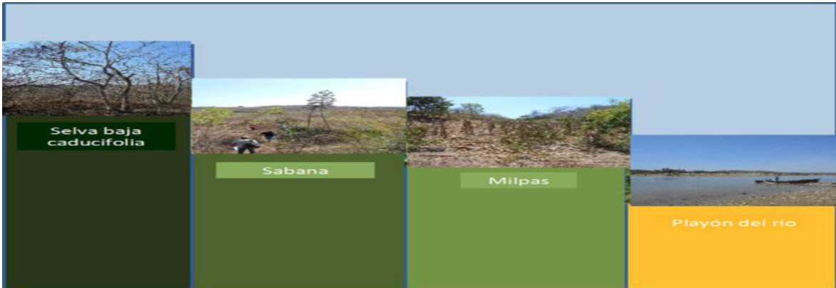
Figura 2: Entornos Locales

lo que ha incrementado la exposición del suelo y propiciado un proceso acelerado de erosión y reducción en la captación de agua al subsuelo, afectando la disponibilidad de agua en los pozos artesanales, en especial en los meses de calor. Este efecto es notable en la margen derecha del río Papagayo. Este proceso es ocasionado por el corte y la tala de las especies locales para obtener carbón vegetal para comercialización y leña para cocinar.