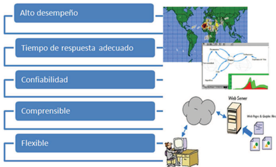
Figura 3. Características de un Sistema Experto

En la figura 4. se puede observar la arquitectura del sistema experto que evalúa la calidad ambiental a partir de la técnica ERFCA. Los actores principales son el usuario,