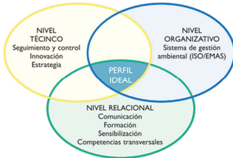
Figura 2. Competencias requeridas en el especialista humano

La técnica de Evaluación Rápida de Fuentes de Contaminación Ambiental, [ERFCA] (Weitzenfeld 1989) y su modificación por Econopoulous en 2002 para fuentes de contaminación de aire permite la realización de inventarios de fuentes contaminantes y sus resultados son obtenidos mediante el empleo de indicadores de estado de calidad ambiental tipo Batelle, que establecen criterios de valoración y una estimación de contaminación generada en fun-