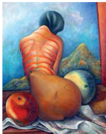
Fotografía de la portada: La Sainte Victoire (2002). Obra pictórica de José Suárez.