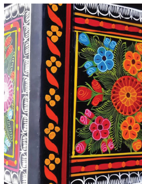
Fotografía de la portada: Cajita de Olinalá (detalle). Juan Baltazar Cruz Ramírez (2016)