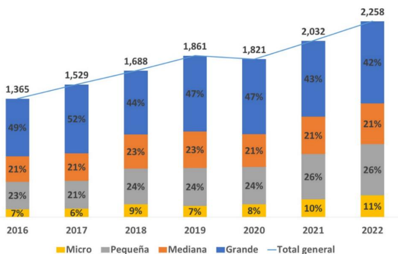
Crecimiento del Distintivo ESR del 2016 al 2022

Nota. La figura muestra el crecimiento de las Empresas en México evaluadas para obtener el distintivo ESR.