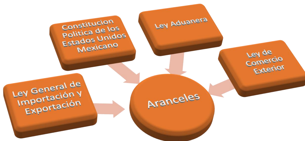
Figura 2. Marco Legislativo de los aranceles. Elaboración propia conforme a la legislación vigente al 30 de septiembre de 2018.