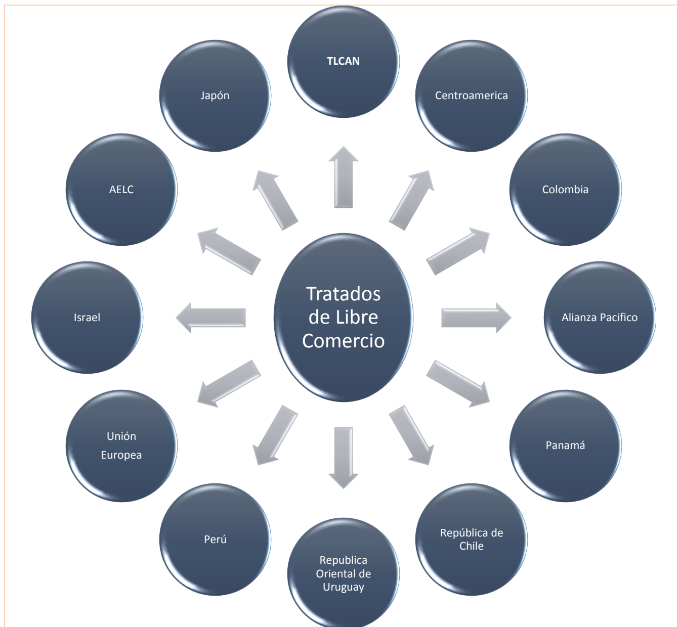
Figura 1. Tratados de Libre Comercio. Elaboración propia con arreglo a los tratados de libre comercio que México tiene firmado hasta abril 2018.