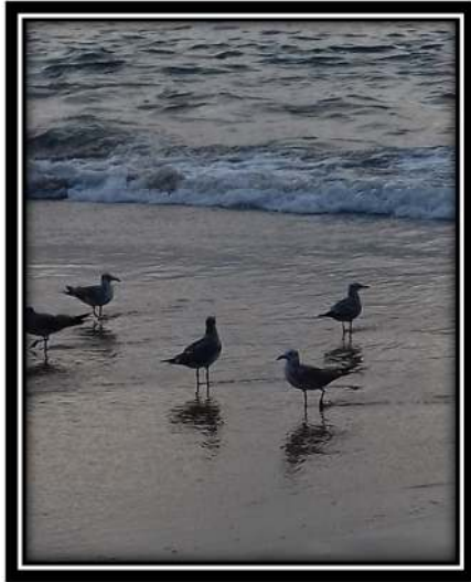
Figura 4. Larus heermanni (Cassin, 1852)