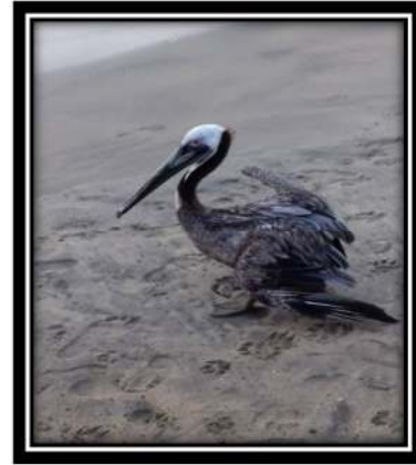
Figura 3. Pelecanus occidentalis murphyi (Wetmore, 1945)

Alimentación: Este pelicano se alimenta sobre todo de pescado, que captura en las aguas marinas cercanas a la costa, pues rara vez se lo ve extraviado lejos de ellas. Para capturar los peces utiliza su enorme bolsa a modo de red, dejando que el agua drene por los bordes antes de tragar la pesca así obtenida.