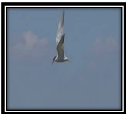
Figura 5. Sterna antillarum (Lesson, 1847)

Alimentación: Omnívora pequeños peces, animales marinos e insectos