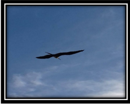
Figura 2. Fregata magnificens (Mathews, 1914)