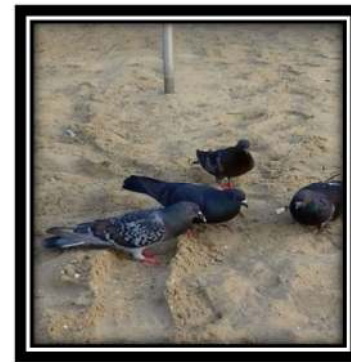
Figura 6. Columba livia (Gmelin, 1789)

Alimentación: Su alimentación se basa fundamentalmente en los granos.