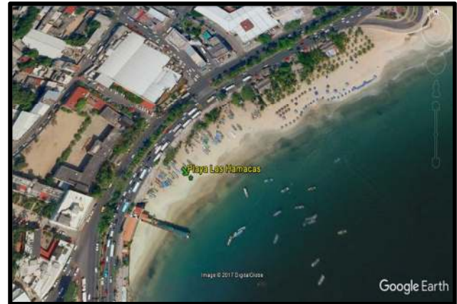
Figura 1. Localización del área de estudio

Esta playa presenta en su mayoría agua turbia con poca visibilidad, con una longitud de 5 m aproximadamente y la altura media sobre el nivel del mar es de 0.4 metros. Presenta una biodiversidad de algas principalmente clórofitas, una riqueza de bivalvos y gran diversidad de peces.