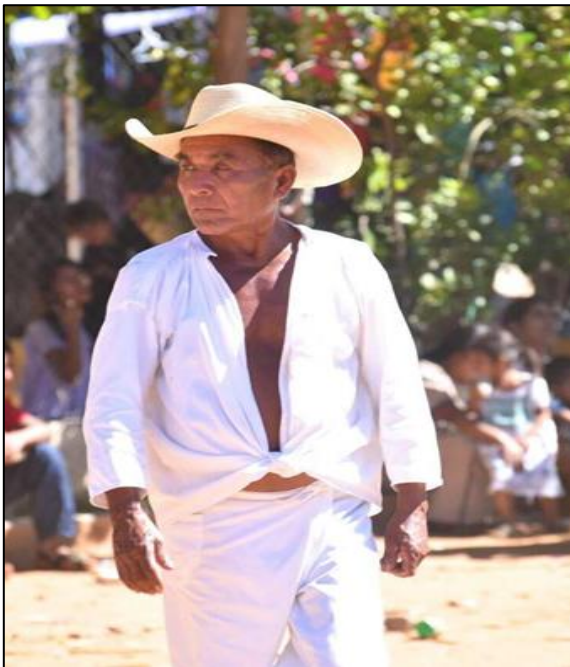
Ilustración 4.-Señor amuzgo portando su vestimenta típica.

Las mujeres usan la enagua, que son faldas de distintos colores que se amarran en los hombros y en las orillas tienen adornos o grecas amuzgas, encima de las enaguas usan un hermoso huipil colorido, elaborado en telar de cintura por ellas mismas, en el huipil bordan figuras geométricas, figuras de animales o flores, simplemente expresan sus sentimientos en cada uno de ellas. Anteriormente andaban descalzas y en la actualidad usan sandalias, huaraches cruzados o de piel.