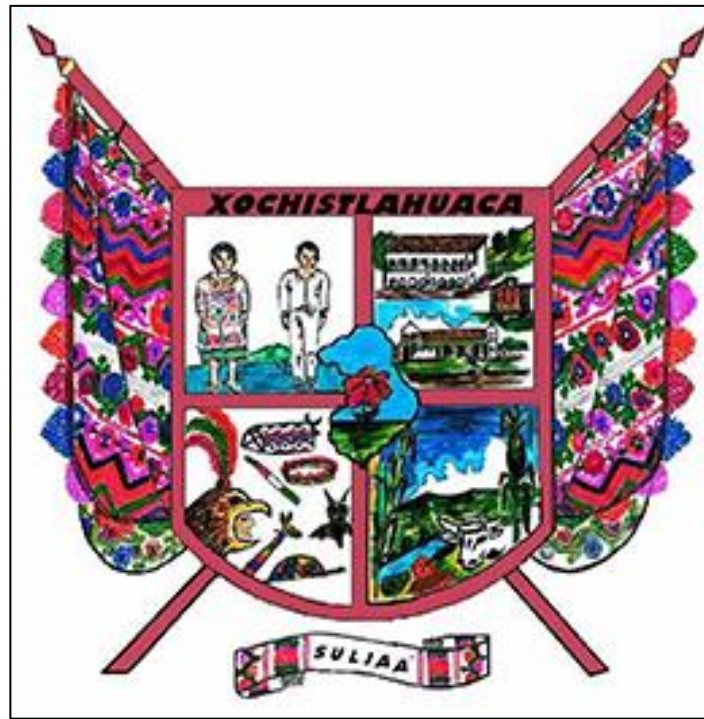
Ilustración 3.- Escudo municipal de Xochistlahuaca Guerrero.

Ahora bien, el escudo en su conjunto representa la unidad, el trabajo y el anhelo por el bienestar común de este municipio amuzgo.