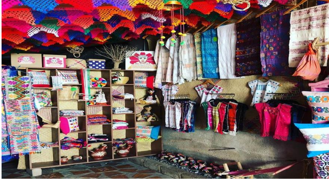
Ilustración 6.-La imagen muestra parte de la artesanía que se produce en Xochistlahuaca