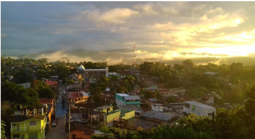
Ilustración 2.- Vista panorámica de Xochistlahuaca

Con respecto a la agricultura, se considera que sólo el 20% de las tierras comprendidas en el territorio amuzgo son idóneas para la siembra, pues el 80% restante está constituido por terrenos montañosos, la productividad agrícola depende del aprovechamiento de cultivos de monte de temporal. En estas condiciones la tecnología es rudimentaria e inadecuada; no existe la capacidad técnica ni económica para absorber los gastos de mano de obra para las labores de siembra.