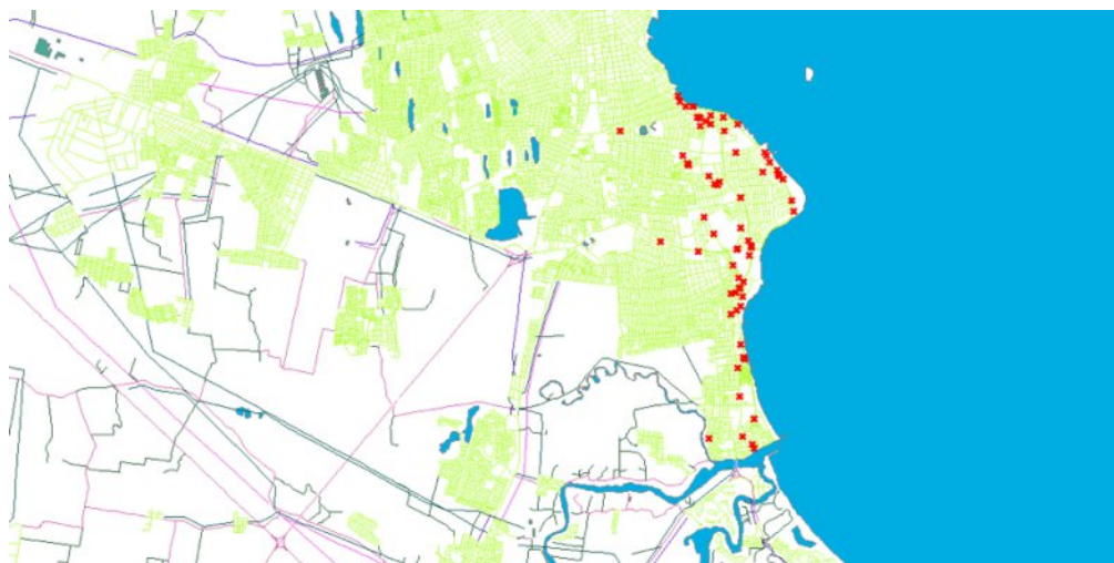
Imagen 5: Aglomeración hotelera de Boca del Río – Veracruz. 2017.

Las marcas rojas que representan los hoteles en el mapa se expanden notoriamente, lo que hace que la aglomeración en este lugar sea dispersa, pero no por eso no existe aglomeración ya que esta es