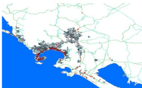
Imagen 4: Aglomeración hotelera de Acapulco – Guerrero. 2016.