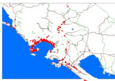
Imagen 3: Aglomeración hotelera de Acapulco – Guerrero. 2015.