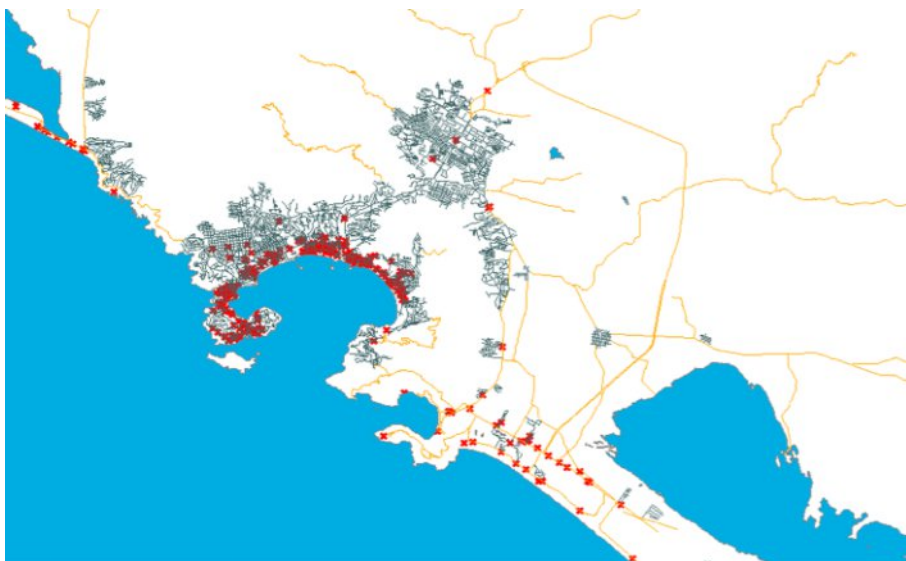
Imagen 1: Aglomeración hotelera de Acapulco – Guerrero. 2017.