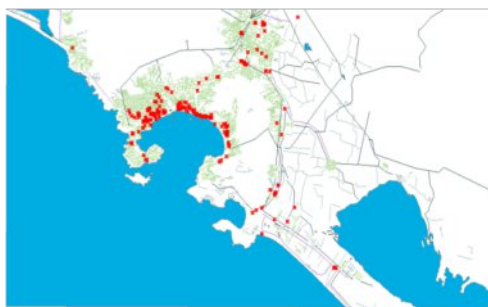
Imagen 8: Mapa de Centros Nocturnos, Bares, Cantinas y Similares en Acapulco.

En el caso de la aglomeración hotelera en Acapulco y Boca del Río, estas han generado una externalidad inmediata que son otras aglomeraciones que se enriquecen del sector hotelero pero que lo beneficia también, algunas de estas aglo-