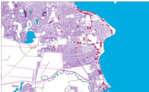
Imagen 6: Aglomeración hotelera de Boca del Río – Veracruz. 2011.