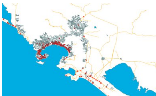
Imagen 2: Aglomeración hotelera de Acapulco – Guerrero. 2011.

Como lo evidencian las ilustraciones 2, 3 y 4 la aglomeración hotelera en Acapulco no ha cambiado mucho en los últimos años, en estos mapas se puede apreciar como