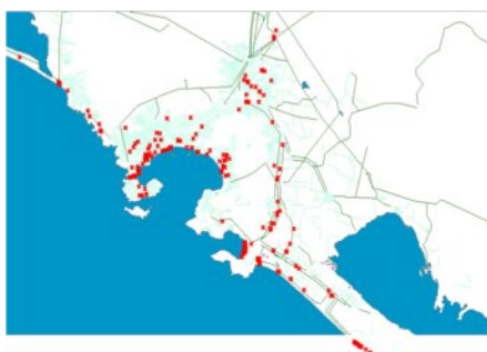
Imagen 10: Mapa de Restaurantes con Servicio de Preparación de Pescados y Marisco en Acapulco.