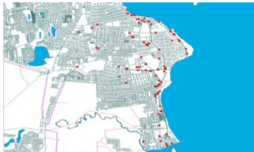
Imagen 7: Aglomeración hotelera de Boca del Río – Veracruz. 2015.