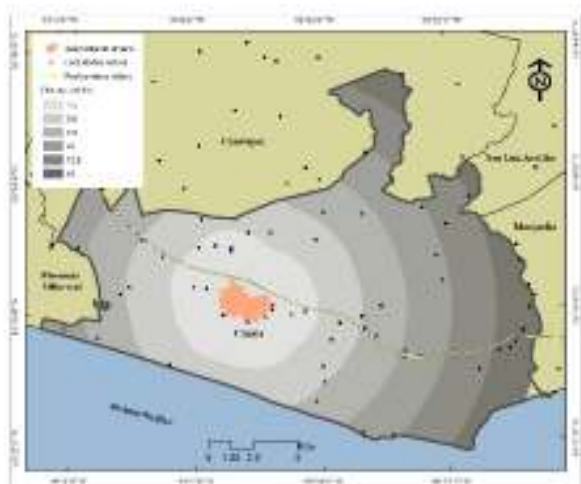
Figura 4. Copala: contexto general

De acuerdo con la Encuesta Intercensal 2015, en el municipio viven 14 304 personas, aproximadamente 0.4% del total de guerrerenses. Las mujeres representan 51% de la población municipal, y los hombres 49% (Tabla 1). En cuanto a los grupos de edad, la población comprendida entre los 0 y 29 años es la más numerosa; en total son: 8 005 personas (56% del total municipal). En Copala existe un total de 58 localidades, por el número de habitantes, sobresalen: Copala (6 619), Ojo de Agua (Las Salinas) (1 477), Atrixco (876), Las Peñas (778), Islaltepec (Las Parotas) (676), Colonia Juan N. Álvarez (Playa Ventura) (555), El Carrizo (507) y Las Lajas (464), en el resto de los asentamientos humanos, la población es menor a 300 habitantes (Tabla 2). Existe una alta concentración demográfica en ese sitio, otro indicador de esta situación es el número de viviendas habitadas; en Copala existen 1 675, en Ojo de Agua (Las Salinas); 368, en Atrixco; 201, en Las Peñas; 189, en Islaltepec (Las Parotas); 161, en El Carrizo; 135, en Colonia Juan N. Álvarez (Playa Ventura); 127 y en Las Lajas; 103. Según el criterio cuantitativo de INEGI, únicamente la cabecera municipal es considerada una localidad urbana y las otras 57 están catalogadas como rurales (INEGI, 2015).