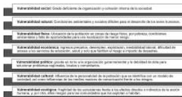
Figura 3. Dimensiones de la vulnerabilidad.

torno a la propuesta de CONEVAL, pues la vulnerabilidad no puede ser definida únicamente a partir indicadores relacionados con la pobreza.