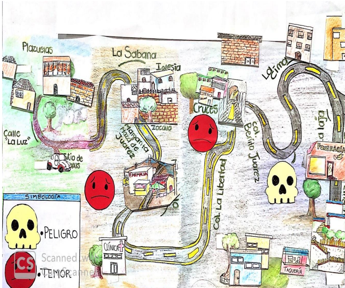
Figura 1. Recorrido cotidiano: ejemplo de cartografía colaborativa