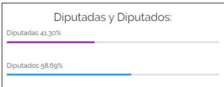
Esquema 2: Diputadas y diputados

Ahora bien, en cuanto a los diputados que son los que sesionan, su organización está de la siguiente forma: