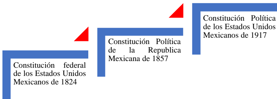
Esquema 1: Constituciones de México.

La modalidad en que se conforma el congreso no variado mucho desde ese entonces, salvo las normas que lo rigen. Estas han estado en constante movimiento. Como ejemplo, desde 1824 hemos tenido 3 constituciones: