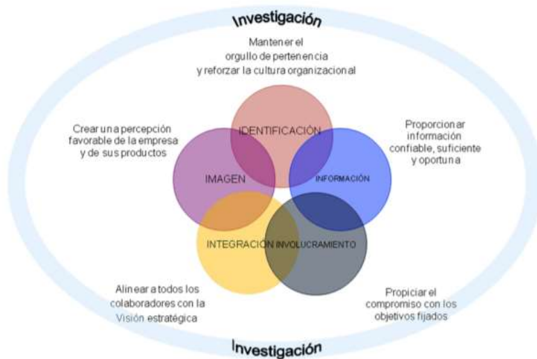
Esquema 5: proceso de comunicación organizacional interna. Andrade (2005, p. 16)

Como podemos observar en la representación gráfica anterior, cualquier objetivo depende de una investigación previamente realizado, solo así se asegurará su alcance y efectividad en la mayoría de los casos (siempre hay excepciones).