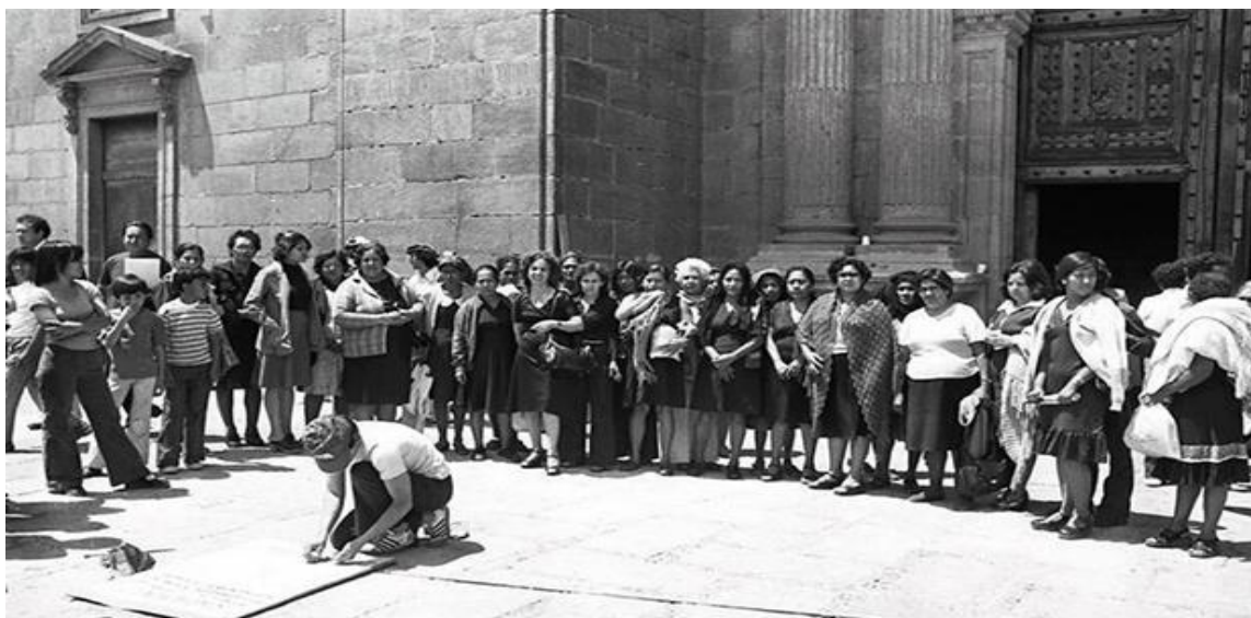
Fotografía No. 3 21

Participación de Gela en la histórica huelga de hambre del 28 de agosto de 1978 a las fuercas de la Catedral metropolitana en la Ciudad de México.