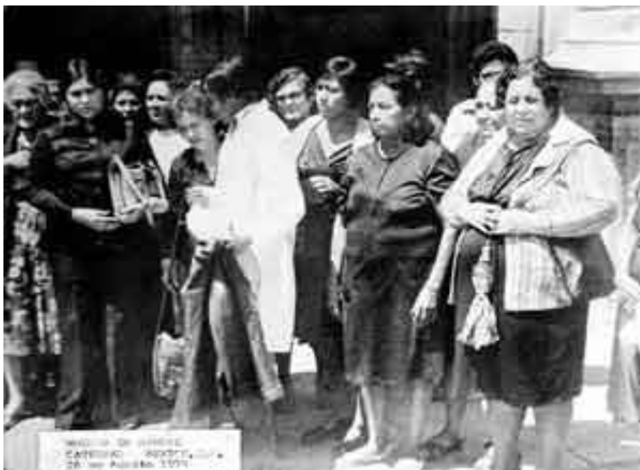
Fotografía No. 4 Archivo La Jornada. 22