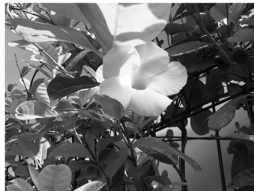
Figura 3. Pentalinon luteum .