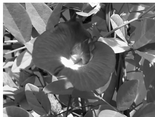
Figura 4. Clitoria ternatea . Fuente: Elaboración propia.