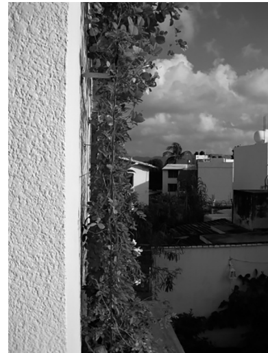
Figura 2. Detalle de la estructura.